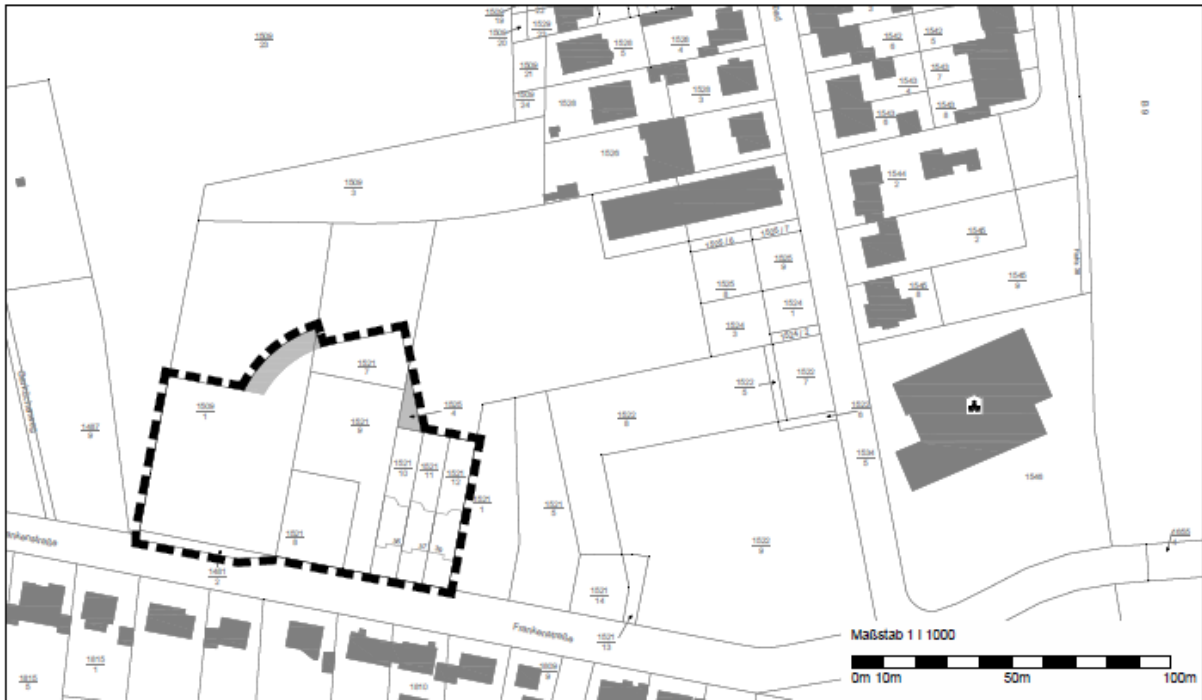
Geltungsbereich Bebauungsplan „Ehemaliges Sternjakob-Areal, Teil B“

Der Bebauungsplanentwurf, bestehend aus Planzeichnung, textlichen Festsetzungen, Vorhaben- und Erschließungsplan sowie Begründung und Umweltbericht, in der Fassung vom 15.01.2025 sowie die Fachgutachten und umweltbezogenen Stellungnahmen können in der Zeit von