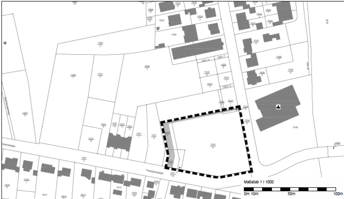
Geltungsbereich Bebauungsplan „Ehemaliges Sternjakob-Areal, Teil C“

Der Geltungsbereich des Bebauungsplans „Ehemaliges Sternjakob-Areal, Teil C“ wurde geändert. Er umfasst die Flurstücke auf der Gemarkung Frankenthal mit den Flurstücknummern 1521/13 und 1522/6 vollständig sowie die Flurstücke mit den Flurstücknummern 1521/14, 1522/5, 1522/7, 1522/8 und 1522/9 teilweise. Der Geltungsbereich des Bebauungsplans ist im nachfolgenden Lageplan dargestellt.