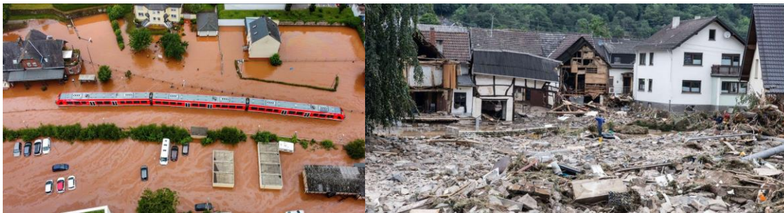
Abbildung 1: Flutkatastrophe in Rheinland-Pfalz 15.07.2021 / 17.07.2021

Die dazugehörigen Bilder sollten uns anspornen, unsere Klimaschutzbemühungen weiterzuführen bzw. zu intensivieren.