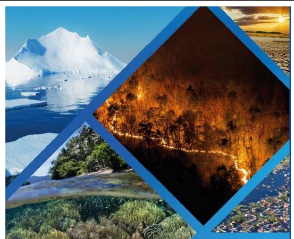
Abbildung 2: Die Zeit für Klimaschutzmaßnahmen drängt

Motivation und Ziel des beschlossenen Klimaschutzkonzepts war, die CO 2 -Gesamtemissionen im Stadtgebiet maßgeblich zu senken und damit die Abhängigkeit der Stadt von Energieimporten zu Gunsten regionaler Ressourcen zu reduzieren.